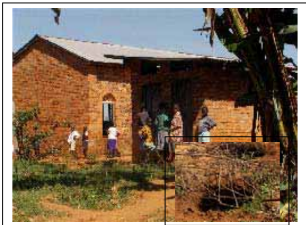
Het sanitair blok voor een school van 2.500 leerlingen (inzet: één van de 'sanitaire' putten buiten)

En of we misschien mee voor het herstellen van de ruiten kunnen zorgen of voor een electriciteitsaansluiting in de school... over een computer hebben ze nog niet durven dromen.