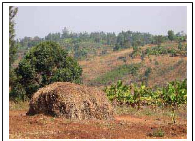
Wat een natuur...