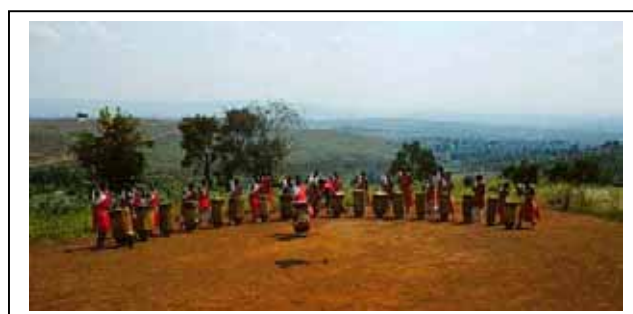
De tambourinaires van Gishora