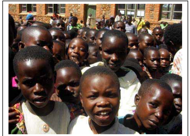
Een onthaal om niet te vergeten

Alhoewel er pas de avond vóór ons bezoek afspraken gemaakt werden, is het onthaal ongelooflijk warm en massaal.